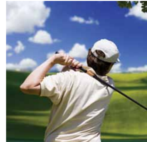
Kaynak: (SRI International, 2008)