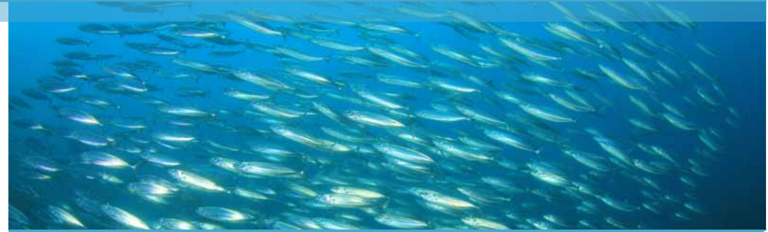
Türler İtibariyle Su Ürünleri Yetiştiriciliği (ton)